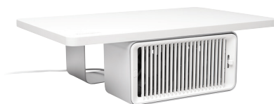
CoolView™ Wellness-monitorstandaard met bureauventilator K55855WW

Uit onderzoek blijkt dat een optimaal ontworpen werkstation voordelen voor zowel de gezondheid als productiviteit biedt die een verband leggen tussen een goede houding en minder ziekteverzuim, en een comfortabele kantooromgeving en een verhoogde activiteit van de werknemers. Een verbeterde houding, ondersteuning voor de juiste ooghoogte en een comfortabele kantooromgeving zijn slechts enkele manieren waarop de CoolView Wellness-monitorstandaard met bureauventilator het welzijn van werknemers stimuleert.